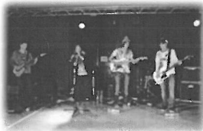
LES ACTIVITES CULTURELLES